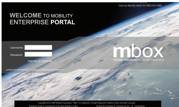
Portal online display (Mobility Enterprise Portal)