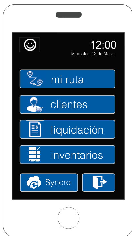
Mobile Display (Mobility Dynamic App)

donde llevan los productos hasta el punto de venta y ahí se realiza el proceso de toma de pedido y entrega.