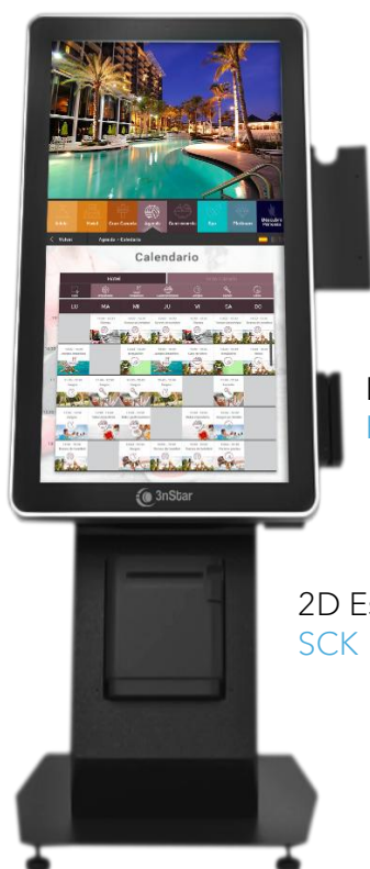
Soporte Para Terminal De Pago K21-PTHolder